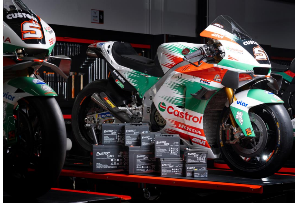
ES Battery accompagne le team LCR Honda en tant que sponsor technique

L'arrivée en MotoGP en tant que sponsor technique de l'équipe LCR Honda offre à EnergySafe de nouvelles opportunités d'améliorer la gamme déjà vaste, grâce aux données collectées pendant les courses et aux retours reçus des pilotes qui comptent parmi les meilleurs pilotes du monde.