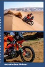
Ases de las arenas del desierto

En la edición de este año, el piloto francés Benjamin Melot (imagen superior) ha corrido el Dakar con la batería de marca Energysafe y así lo ha mostrado en sus redes sociales, incluso mostrando la batería en su box en pleno desierto. Por su participación en el raid más duro del mundo, los amantes de la arena también conocen esta marca de baterías.